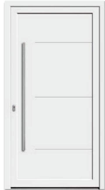
AK 710-92 mit Profilierung Farbe: Weiß | Griff: 1200 mm Edelstahl-Griffstange Bauart: Einsatzfüllung Tür-ID: PS25-7710-92