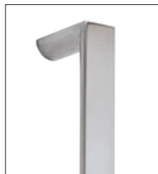
halbrunde Edelstahl- Griffstange (gegen Mehrpreis) Länge 400 mm bis 1600 mm