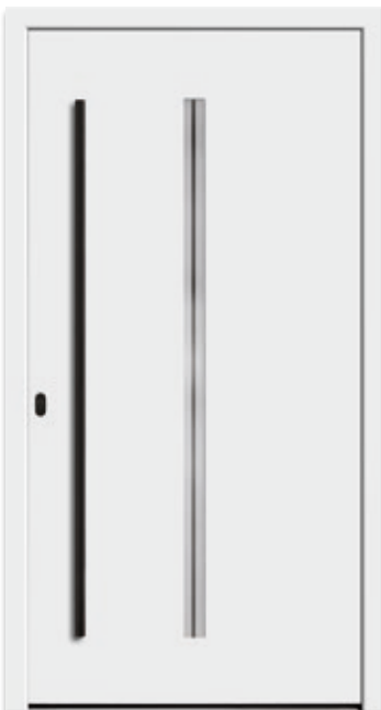
AK735-50 Farbe: Weiß | Glas: G 1459 mattiertes Glas mit klarem Streifen | Griff: 1600 mm Schwarzstahl-Griffstange Bauart: Aufsatzfüllung Tür-ID: PS25-7735-50c