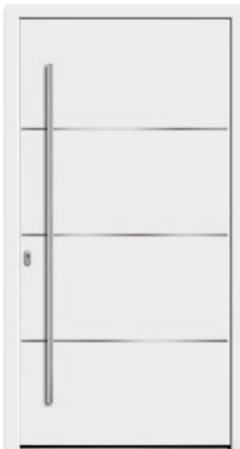
AK 703-94 Lisenen Edelstahl-Design | Farbe: Weiß Griff: 1600 mm Edelstahl-Griffstange Bauart: Aufsatzfüllung Tür-ID: PS25-7703-94 Alternativ: 7703-95 mit Lisenen in Schwarzstahl-Optik