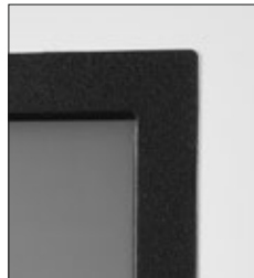
Rahmen in Schwarzstahl-Optik (-75)