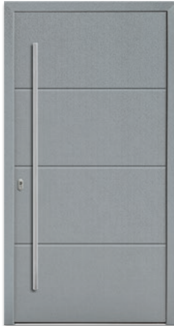
AK 703-92 mit Profilierung Farbe: Dekor Grau Griff: 1600 mm Edelstahl-Griffstange Bauart: Aufsatzfüllung Tür-ID: PS25-7703-92