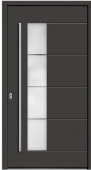
AK706-52 mit Profilierung Farbe: DB 703 | Glas: G 1406 mattiertes Glas mit klaren Streifen Griff: 1600 mm Edelstahl-Griffstange Bauart: Aufsatzfüllung Tür-ID: PS25-7706-52