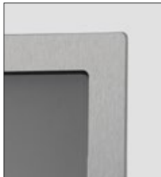
Rahmen in Edelstahldesign (-73)