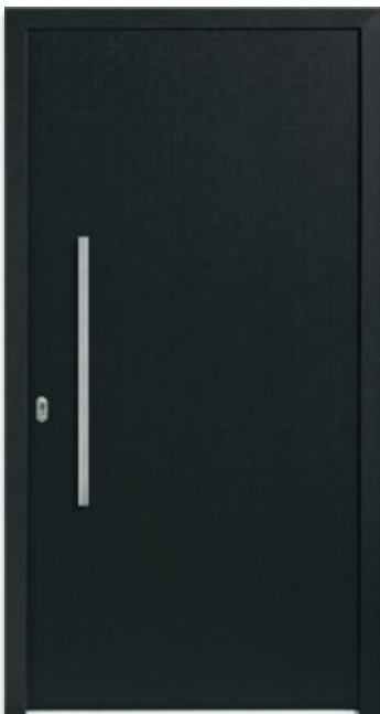
AK 794-90 Farbe: Dekor Anthrazitgrau Griff: 800 mm Edelstahl-Griffstange Bauart: Aufsatzfüllung Tür-ID: PS25-7794-90