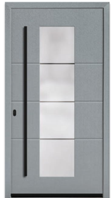
AK832-52 mit Profilierung Farbe: Dekor Grau | Glas: G 5003 mattiertes Glas mit klaren Streifen Griff: 1600 mm Schwarzstahl-Griffstange Designsockel: 2.205.03 Bauart: Aufsatzfüllung Tür-ID: PS25-7832-52