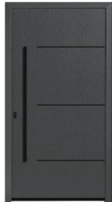
AK 710-95 Lisenen Schwarzstahl-Optik Farbe: Dekor Basaltgrau Griff: 1200 mm Schwarzstahl-Griffstange | Bauart: Aufsatzfüllung Designsockel: 2.205.03 Tür-ID: PS25-7710-95 Alternativ: 7710-94 mit Lisenen in Edelstahl-Design