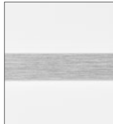
Lisene in Edelstahldesign (-94)