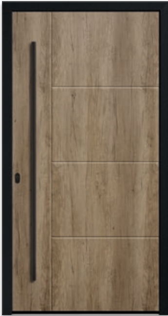
AK 702-92 mit Profilierung Farbe: Dekor Mountain Oak Griff: 1600 mm Schwarzstahl-Griffstange | Bauart: Aufsatzfüllung Tür-ID: PS25-7702-92