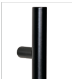
runde Schwarzstahl- Griffstange (gegen Mehrpreis) Länge 400 mm bis 2000 mm