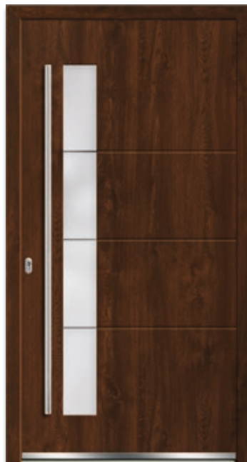
AK831-52 mit Profilierung Farbe: Dekor Nussbaum | Glas: G 5003 mattiertes Glas mit klaren Streifen Griff: 1600 mm Edelstahl-Griffstange Designsockel: 2.105.03 Bauart: Aufsatzfüllung Tür-ID: PS25-7831-52