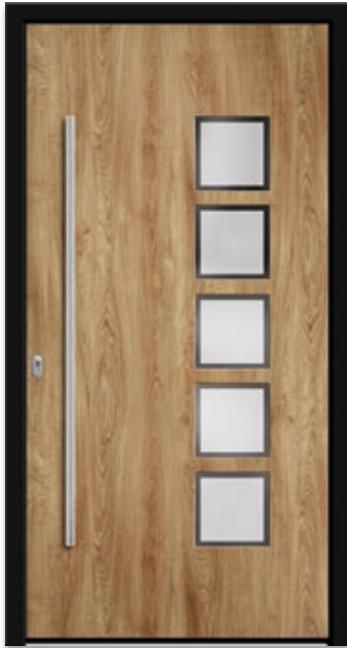
AK739-50 Farbe: Dekor Turner Oak malt Glas: G 500-20 mattiertes Glas mit klarem Rand | Griff: 1400 mm Edelstahl-Griffstange Bauart: Aufsatzfüllung Tür-ID: PS25-7739-50a