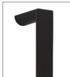
halbrunde Schwarzstahl- Griffstange (gegen Mehrpreis) Länge 400 mm bis 1600 mm