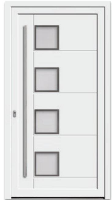
AK577-52 mit Profilierung | Farbe: Weiß Glas: G 500-20 mattiertes Glas mit klarem Rand | Griff: 1600 mm Edelstahl-Griffstange Bauart: Einsatzfüllung Tür-ID: PS25-7577-52