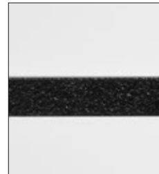
Lisene in Schwarzstahl- Optik (-95)