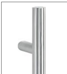
runde Edelstahl- Griffstange (Grundausrüstung) Länge 400 mm bis 2000 mm